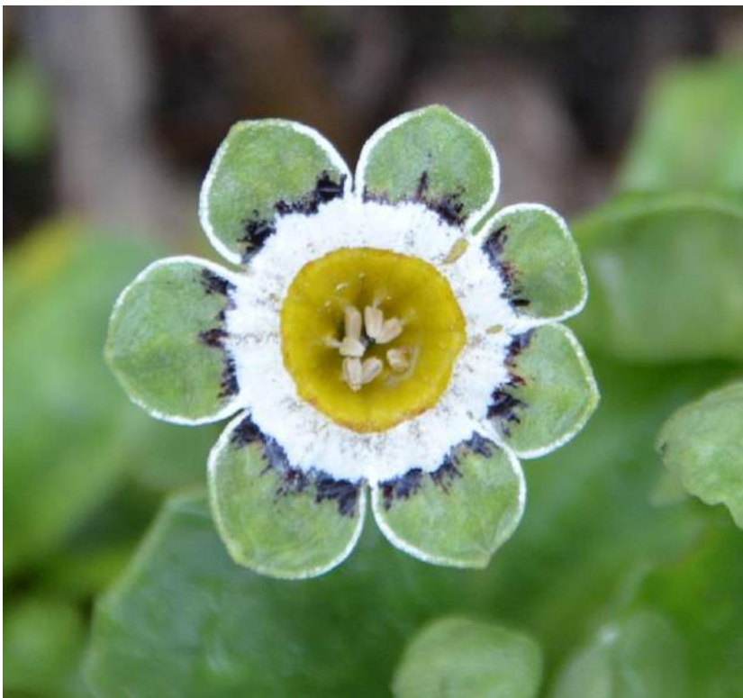
Primula auricula 'Serenity' auricule d'exposition ou de collection, Les lisérées à lisérée vert.

Je profite de l'occasion pour vous présenter aussi d'autres plantes qui fleurissent en même temps que ces merveilles de la nature. Toutes les photos ont été prises les 9 et 10 juin 2015.