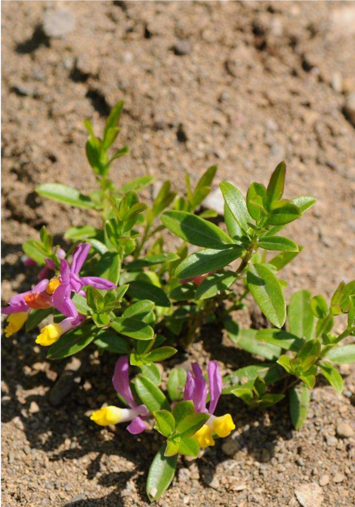
Photo prise au même jardin le 12 juin 2012. La progression du plant a donc été très bonne à Matane.