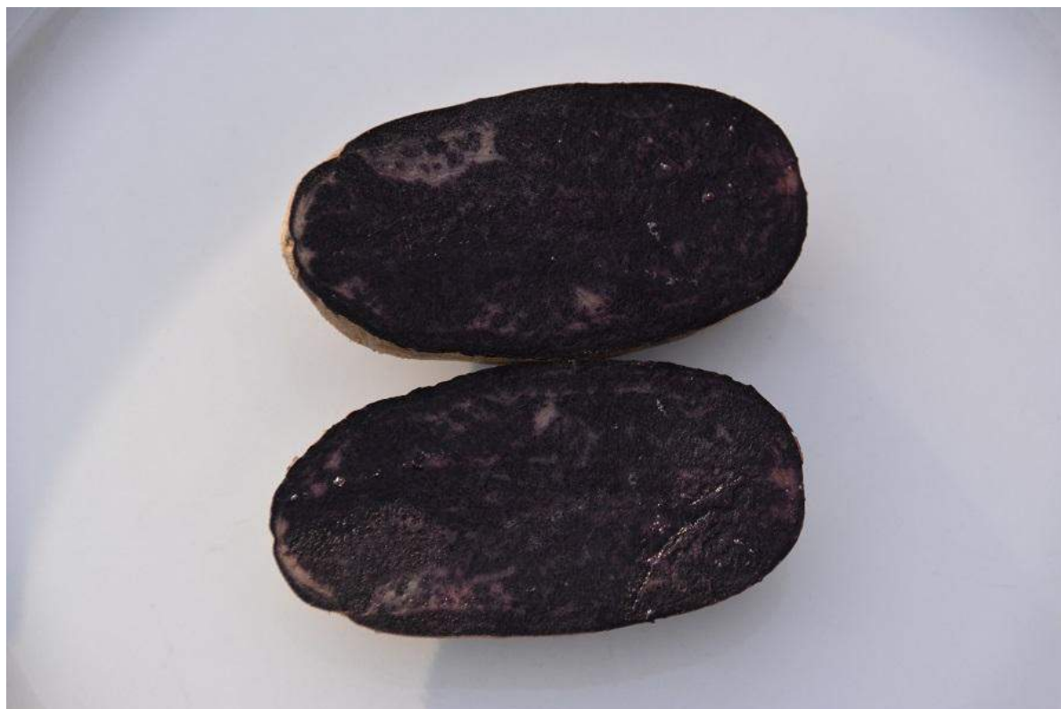
La pomme de terre 'Violet Queen' cru coupée en deux.

Le plant, au port demi-dressé, atteint en moyenne 30 cm (12 po) de hauteur. Les inflorescences sont peu nombreuses. Le temps de récolte est de précoce à moyen. Le tubercule, petit et lent à émerger, est ovale à allongé. Sa peau est bleue et sa chair pourpre foncé conserve sa couleur après la cuisson. Cette pomme de terre met de la couleur dans nos assiettes en plus de nous fournir environ 143 mg d'anthocyane par 100 g. Pour la même quantité la canneberge en contient 200 g.