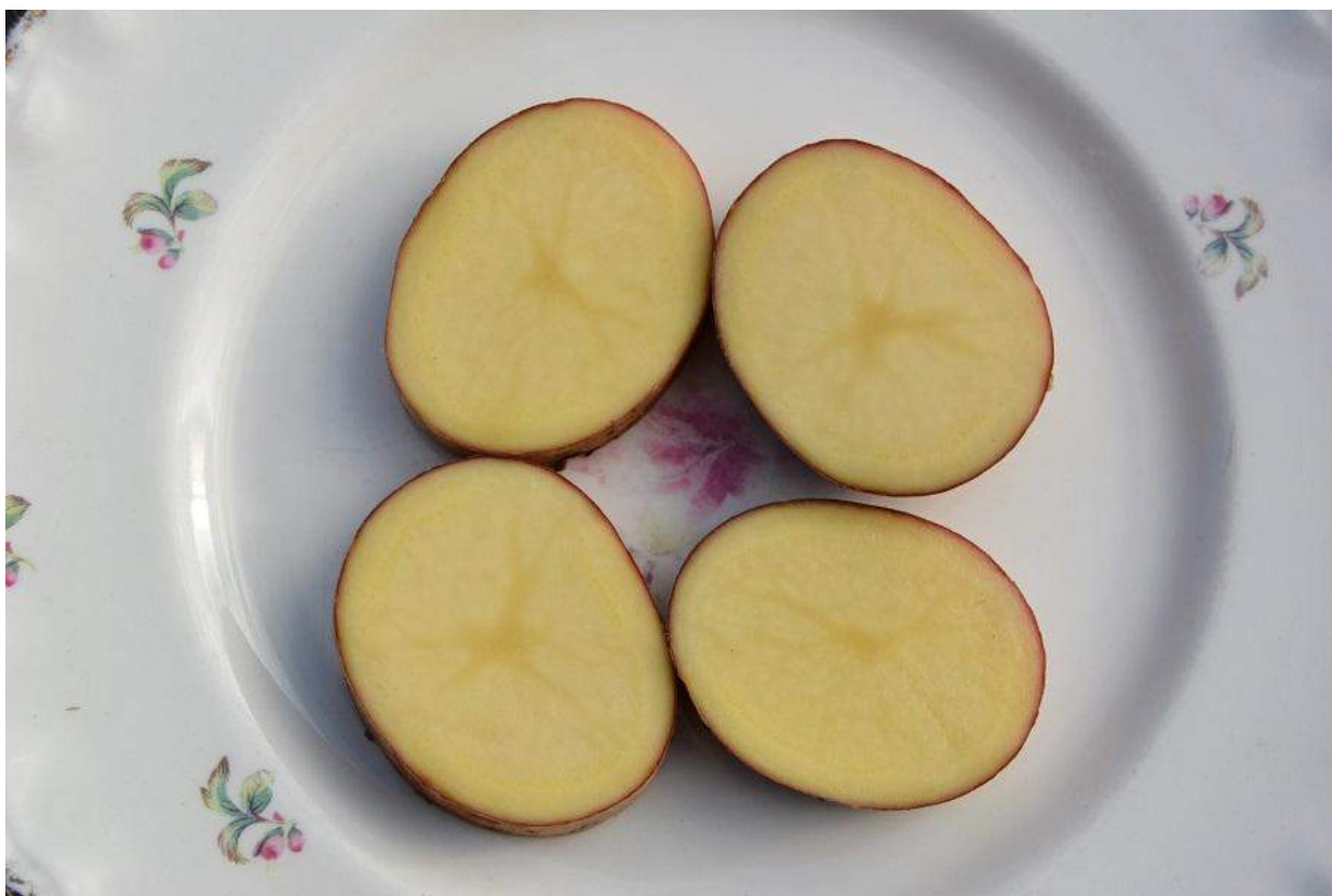
Pomme de terre 'Canberra' cru coupée en tranches.