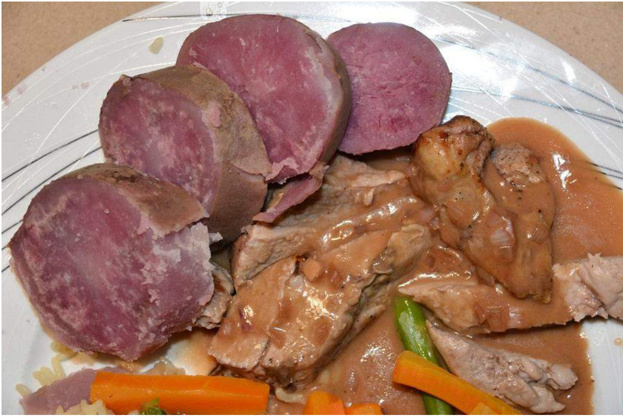
Pomme de terre 'Adirondack Red' bouillie et coupée en tranches.