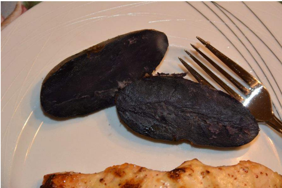
La pomme de terre 'Violet Queen' cuite au four met de la couleur dans nos assiettes.

Il m'a envoyé par la poste des tubercules des quatre sélections suivantes : 'Adirondack Red', 'Canberra', 'Oriana' et 'Violet Queen'. Ceux qui recherchent la variation et le goût seront comblés.